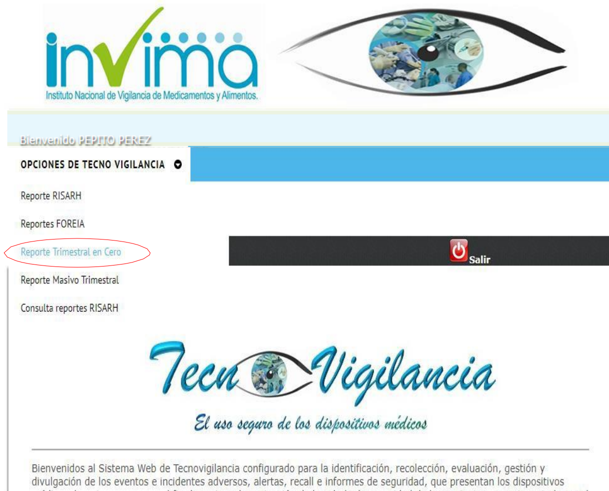
FIGURA 3. INGRESE A “REPORTE TRIMESTRAL EN CERO”