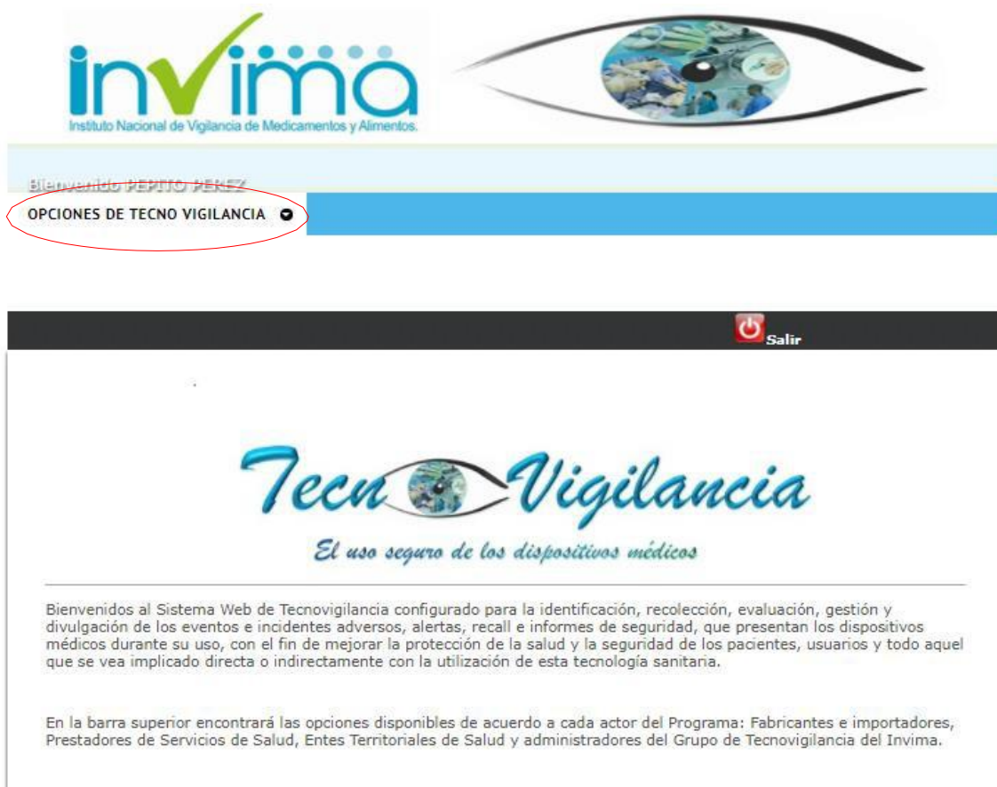
FIGURA 2. SELECCIONE EL MENÚ OPCIONES DE TECNOVIGILANCIA